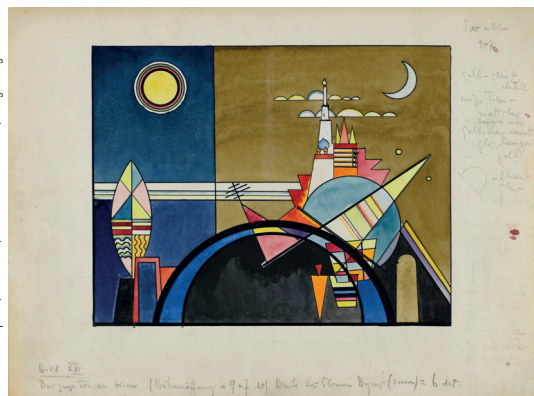
© Centre Pompidou, MIMM-CCI, Dist. RMN-Grand Palais/Georges Meunier/Artistan

Jusqu'au 17 juillet au centre Pompidou-Metz 1, parvis des Droits de l'homme - 57000 Metz Tél. : 03 87 15 39 39