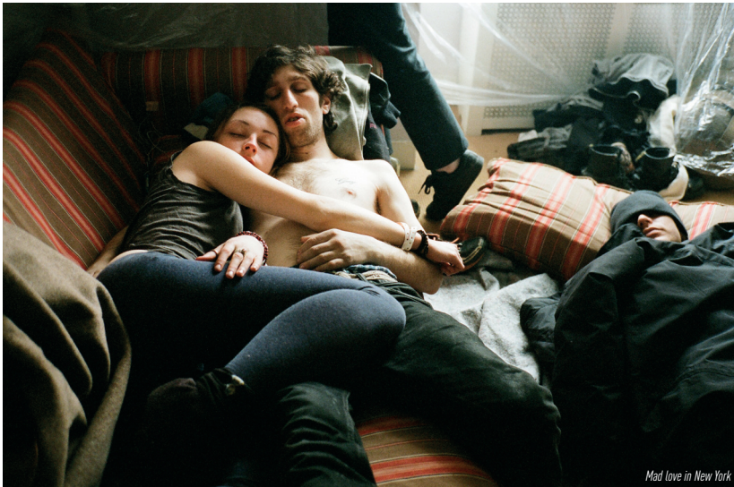
Mad love in New York