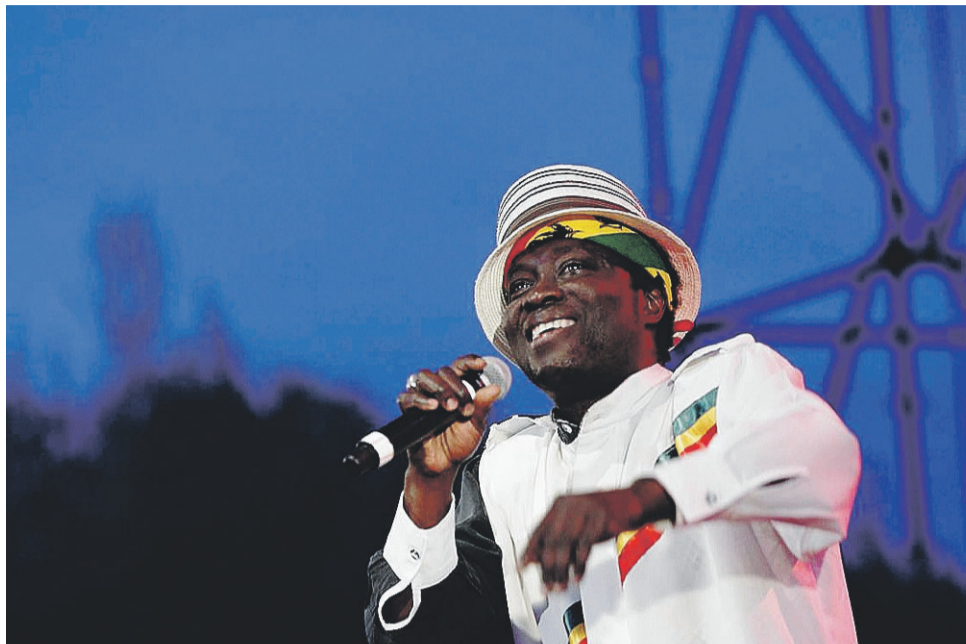
Rod Taylor va faire venir le soleil.