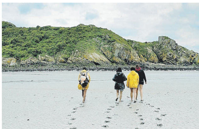
Des embruns qui font du bien...

Exposition ouverte à la mairie annexe, du lundi au vendredi de 9 h à 11 h 45 et de